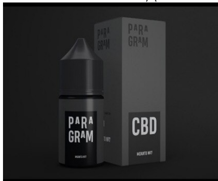
ФОТО УПАКОВКИ ПРОДУКТА:

Разработан дизайн упаковки и презентации на смеси для кальяна и жидкости для ЭСДН;