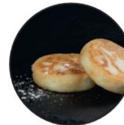
более 10 видов завтраков и выпечки