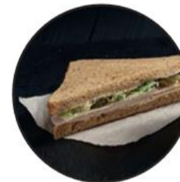
более 20 видов сэндвичей, салатов и горячих блюд