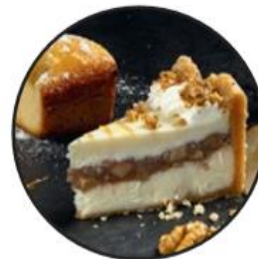
более 30 видов тортов и десертов