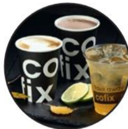
холодные и горячие напитки