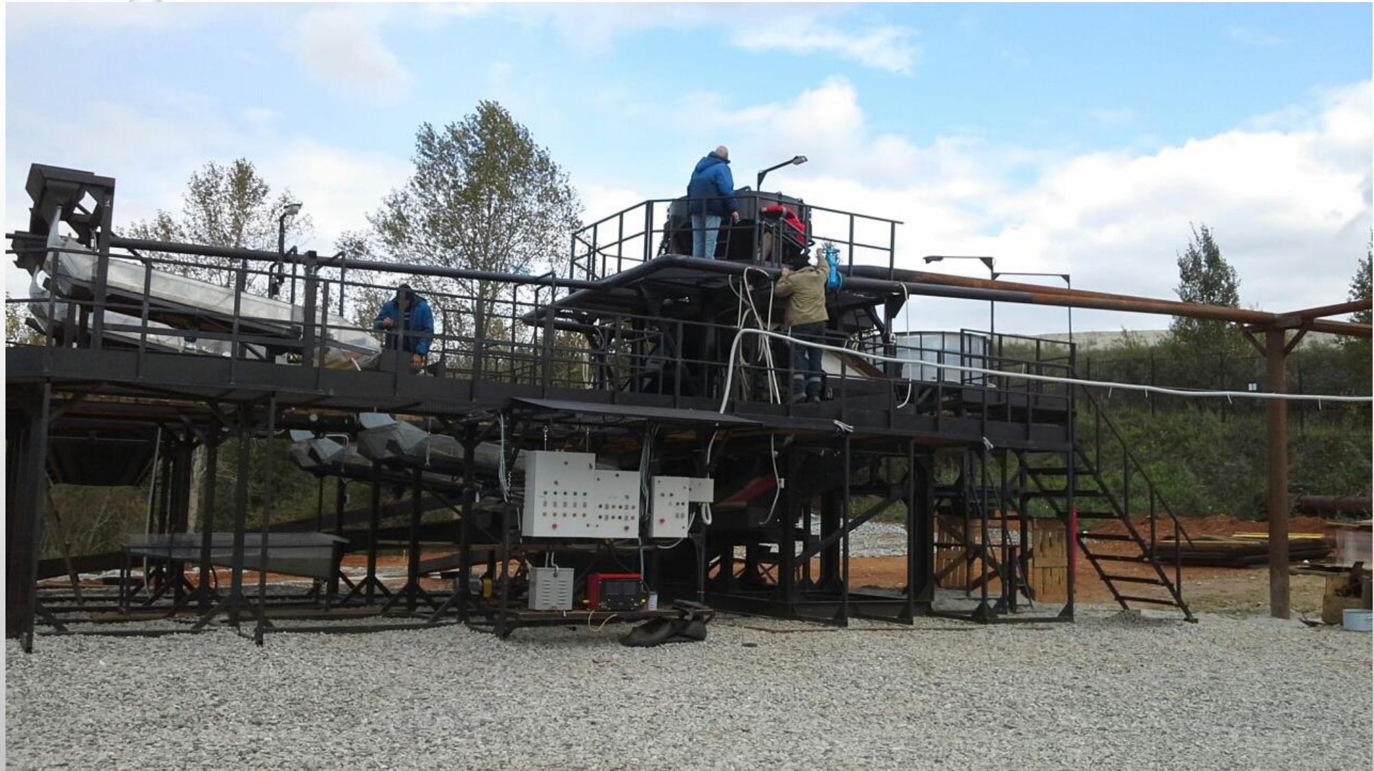
МОБИЛЬНЫЙ ОБОГАТИТЕЛЬНЫЙ КОМПЛЕКС МОЩНОСТЬЮ 15 ТОНН В ЧАС