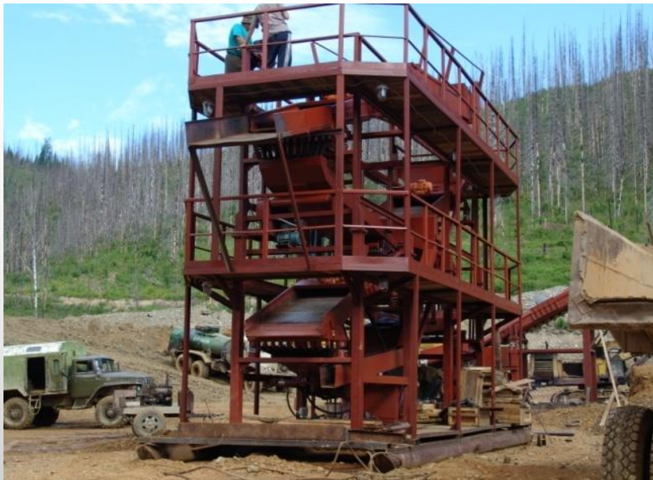
Мобильный обогатительный комплекс мощностью 50 тонн в час