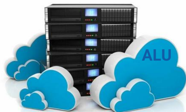
Сервер обработки данных и статистики