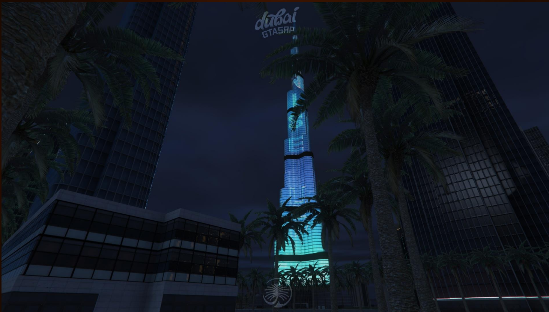
Фото с проекта - Downtown