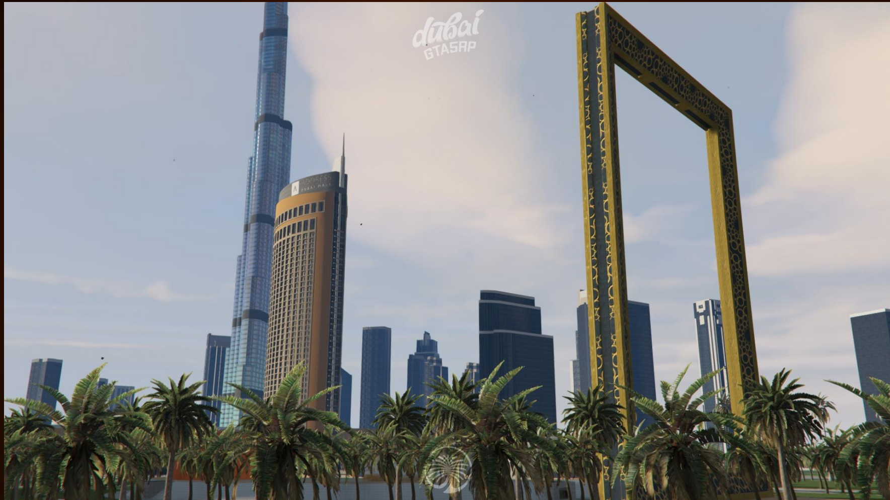
Фото с проекта - Dubai Frame (Zabeel Park)