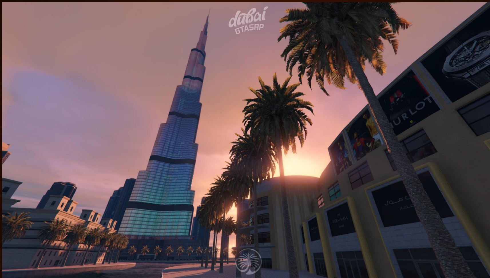
Фото с проекта - Downtown