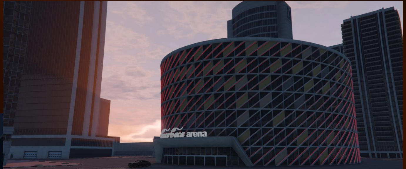
Фото с проекта - Coca Cola Arena