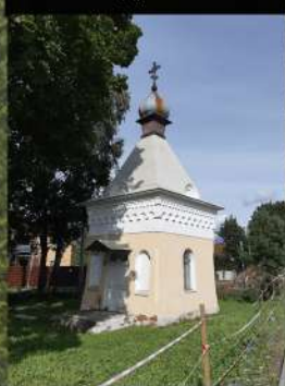
Часовня Александра Невского