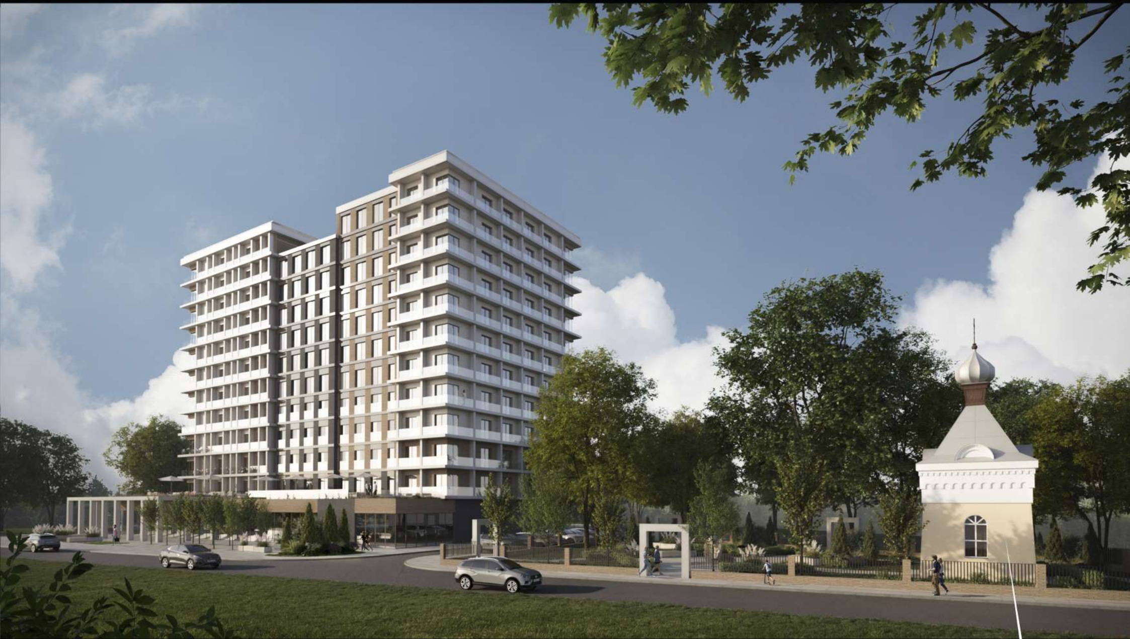
Вид со стороны улицы Центральной.